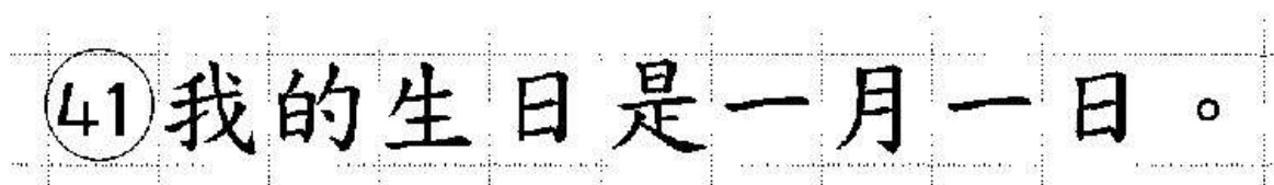
Рис. 24. Образец написания иероглифических знаков

Бланк ответов № 2 (лист 1 и лист 2) по китайскому языку (рис. 22, 23) предназначен для записи ответов на задания с развернутым ответом по китайскому языку (строго в соответствии с требованиями инструкции к КИМ ЕГЭ и к отдельным заданиям КИМ ЕГЭ). Каждый иероглифический знак и каждый знак препинания следует писать внутри отдельной клетки в поле ответов бланка ответов № 2 (ДБО № 2) (рис. 24).