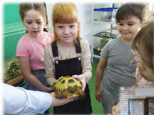
Городская станция юных натуралистов