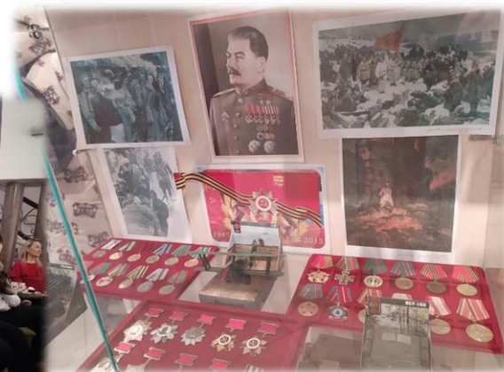
Музей боевой славы