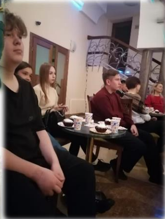
Театр для детей и молодежи